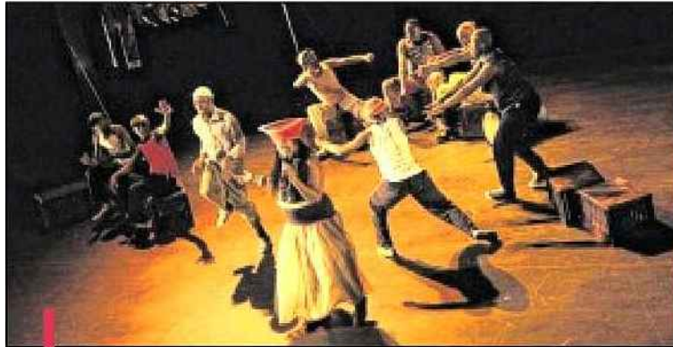
Un cabaret plein d'inventions et d'images venues d'Afrique.